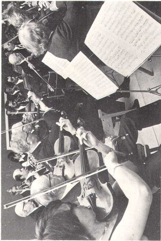
Koncerten den 14. maj 1975, program og udsnit af orkestret

PROGRAM: 1) Felix Mendelssohn-Bartholdy (1809 - 1847): Symfonisk nr. 4 In Skerconeratsdrac 2) Edward Grieg (1843 - 1907): Symfonisk nr. 1 i F-dur 3) Ludwig Beethoven (1770 - 1807): Koncert for violoncel og orkester F-dur Allegro moderato Adagio (con troppo) Tanto Allegro Solist: Mikayilika Ichimay PROGRAM: 4) Gioachino Rossini (1792 - 1868): Barberen i Sevilla, Cuvertur 5) Sibelius (1865 - 1957): Tiesi for violoncel og orkester c-mol op. 24 Solist: Mikayilika Ichimay 6) Johan Halverson (1861 - 1935): Bouris af Saito Andreise 7) Richard Strauss (1864 - 1949): Rosenkvaleren, Vals 8) Antonin Dvorik (1854 - 1904): Rondo for violoncel og orkester c-mol op. 94 Solist: Mikayilika Ichimay 9) A. Turtel: Le Méditant de Gouthe-et-Meuse, Turc